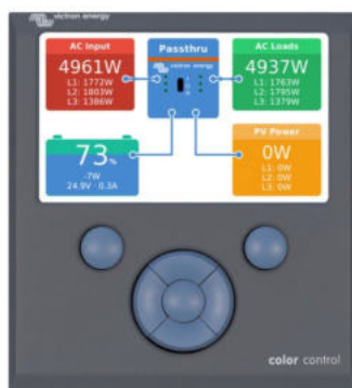
Color Control GX, mit Anzeige eines PV-Systems