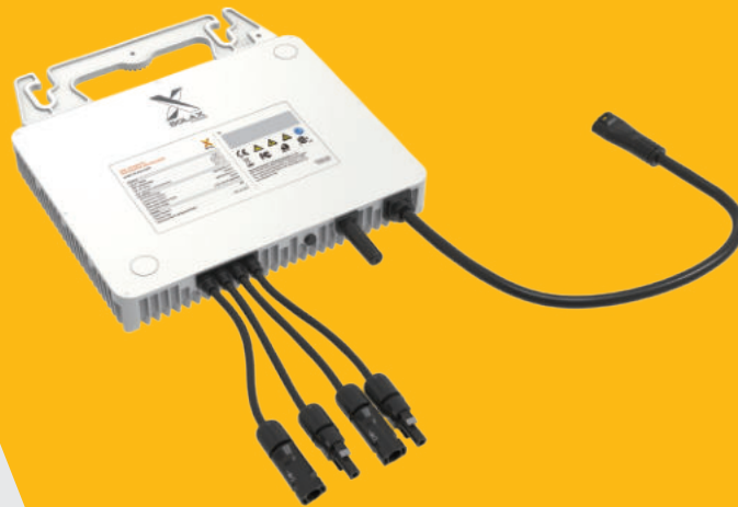
X1-Micro 800 / X1-Micro 900 / X1-Micro 1000 / X1-Micro 1200

Durch die nahtlose Integration der drahtlosen Wi-Fi-Technologie gewährleistet die X1-Micro-Serie eine zuverlässige und konsistente Kommunikation und bietet den Anwendern ein reibungsloses Überwachungs- und Steuerungserlebnis. Als kosteneffiziente Lösung sind diese Mikrowechselrichter sowohl für private als auch für kommerzielle Solaranwendungen bestens geeignet. Darüber hinaus sind sie vollständig mit dem SolaX-Hybrid-System kompatibel und lassen sich nahtlos in verschiedene auf dem Markt erhältliche AC-gekoppelte Systeme integrieren, was ihre Vielseitigkeit und Anpassungsfähigkeit erhöht.